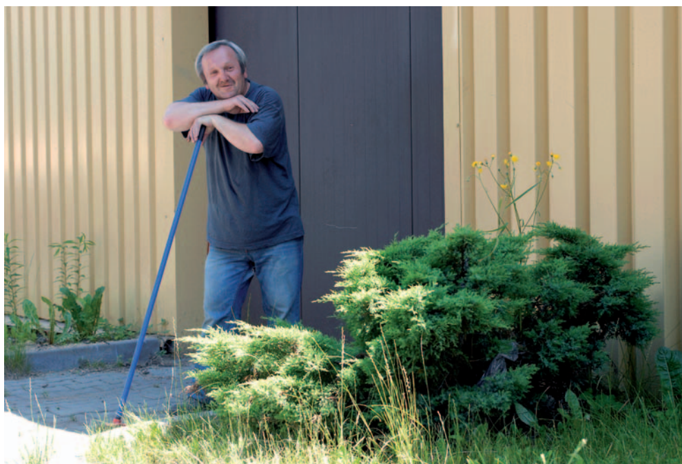
Jeden z pracowników Spółdzielni Socjalnej „Nowy Horyzont”

W 2004 roku miasto przekazało stowarzyszeniu w nieodpłatne użytkowanie na czas nieokreślony zdewastowane hale fabryczne po zakładach „Polifarb”. Jedna z hal pełniła początkowo funkcję magazynu na używany sprzęt RTV i AGD oraz na ubrania i żywność dla najuboższych mieszkańców Cieszyna, inne hale stały