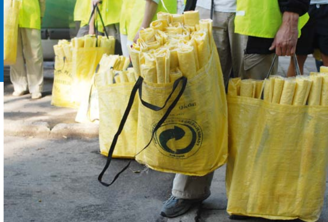
Te żółte torby stały się symbolem proekologicznej działalności mrówek z EKON-u

Na warszawskich osiedlach wszyscy znają „mrówki” w charakterystycznych jasnozielonych kubrakach – zabierają wystawione z mieszkań papierowe, plastikowe, metalowe i szklane opakowania. Wszyscy są niepełnosprawni. Większość to osoby chorujące psychicznie. Wszyscy ich tu lubią i cenią.