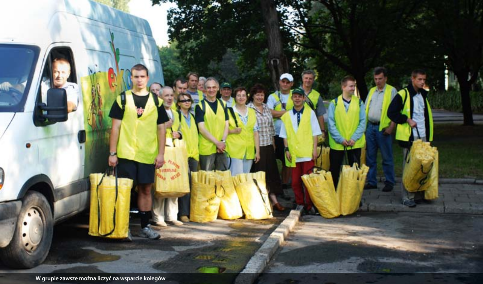
W grupie zawsze można liczyć na wsparcie kolegów

które miało promować zatrudnienie i zatrudniać osoby niepełnosprawne. Jednak efekty ich wysiłków były nikłe: po ośmiu miesiącach udało się znaleźć zatrudnienie na otwartym rynku pracy zaledwie dwóm osobom. Postanowili wtedy stworzyć nową organizację, która znalazłaby taką niszę rynkową, w której łatwiej można było znaleźć pracę dla społecznie wykluczonych. Po analizach rynku zdecydowali się na gospodarkę odpadami opakowaniowymi. Za tym pomysłem przemawiała z jednej strony