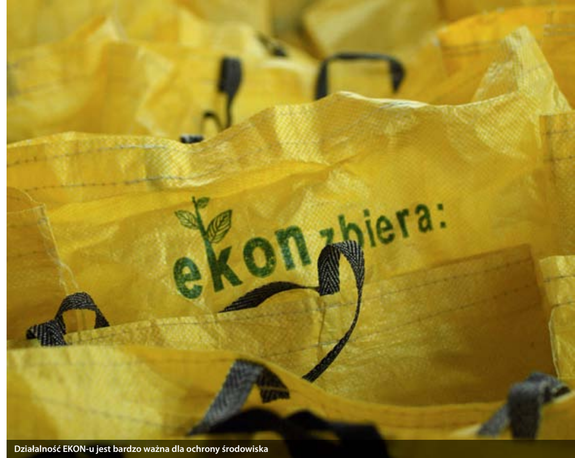
Działalność EKON-u jest bardzo ważna dla ochrony środowiska