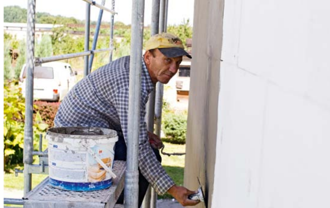
Pracownicy spółdzielni socjalnej wykonują prace budowlane i remontowe m.in. dla miasta i wspólnot mieszkaniowych. Wyrobili już sobie dobrą markę, bo pracują solidnie i terminowo

Wejście na rynek takiego podmiotu jak spółdzielnia socjalna nie zostało