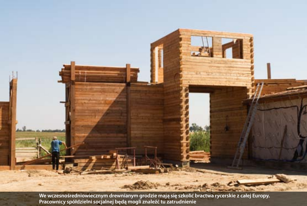
We wczesnośredniowiecznym drewnianym grodzie mają się szkolić bractwa rycerskie z całej Europy. Pracownicy spółdzielni socjalnej będą mogli znaleźć tu zatrudnienie

pomagamy mu w rozwiązywaniu własnych problemów. Przykład: nasz hydraulik. Gdy zakładaliśmy spółdzielnię, strasznie pił. Przychodził na budowę pijany, pił na budowie. Jednak nie skreśliliśmy go od razu. Zaczęliśmy go motywować. W pewnym momencie widać było, że chce iść na leczenie. Porozmawialiśmy z nim. Zaczął się leczyć. Już nie pije. To jest człowiek, który na budowie potrafi zrobić wszystko – hydraulikę, elektrykę, wymuruje, wytykuje. Jego trzeba było z tego wyciągnąć!